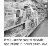
It will use the capital to scale operations in newer cities, mint

Other minority investors include Disruptor Capital,