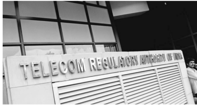
Trai has suggested that the maintenance and upgrading of this digital connectivity infrastructure should be included in the agreements between builders and buyers.

The regulator said the infrastructure will be co-designed and co-created along with building development through collaborations among various stakeholders, including developers and building service providers, which it refers to as property managers,